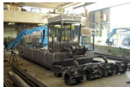
Prototipo dell'imbarcazione progettata per tenere sotto controllo la crescita delle alghe

Per maggiori informazioni sul calendario delle asciutte: www.etvilloresi.it