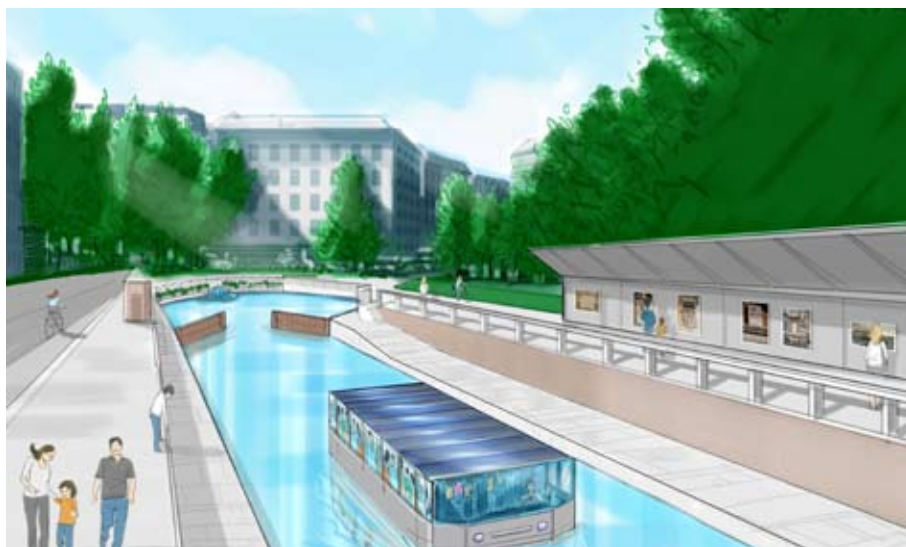
Visualizzazione del bacin-porticciolo in Via Conca del Naviglio (Rendering | Elio Lamarina)

connettere la Conca di Viarenna alla Darsena, il progetto presentato dall'Associazione Amici dei Navigli prevede diverse azioni volte al recupero del complesso monumentale costituito dalla Conca stessa, al ripristino di opere preesistenti e alla costruzione di nuove infrastrutture per consentire la mobilità sia dei pedoni sia dell'ordinario traffico veicolare.