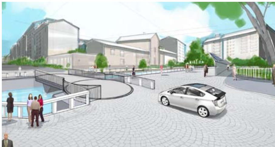
Visualizzazione del ponte girevole di Via Ferrari che consentirà l'attraversamento del canale (Rendering | Elio Lamarina)