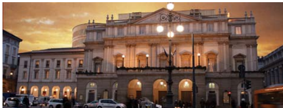
Il Teatro alla Scala.