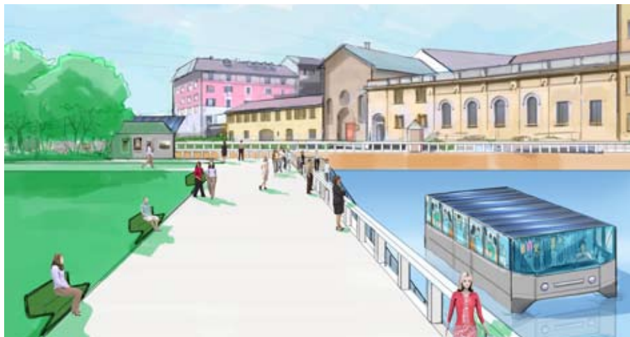
Visualizzazione del bacin-porticciolo con l'approdo (Rendering | Elio Lamarina)