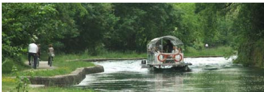
In bicicletta e in battello sul Naviglio