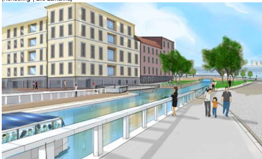
Visualizzazione del nuovo canale sottopassante Viale Gabriele d'Annunzio (Rendering | Elio Lamarina)

apertura del "Tombon", cioè il ponte sotto il quale passava sia il canale sia l'alzaia, con il relativo rialzamento di Viale Gabriele d'Annunzio.