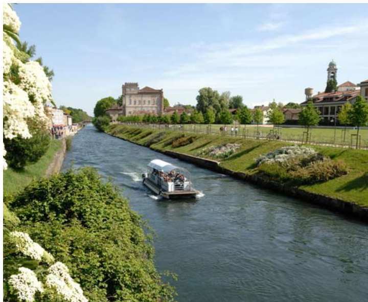
Veduta di Palazzo Archinto sul Naviglio Grande