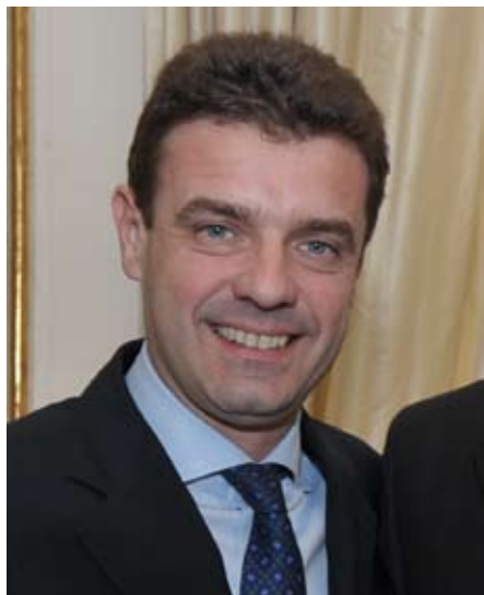
Il Presidente di Regione Piemonte, Roberto Cota

Il progetto di ripristino dell'idrovia Locarno-Milano-Venezia mira a ricongiungere, con un affascinante itinerario turistico, il territorio padano all'Europa transalpina.