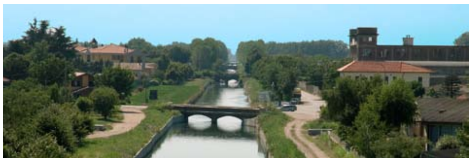
Canale derivato dal fiume Ticino nel Novarese

Presidente della Camera di Commercio di Novara