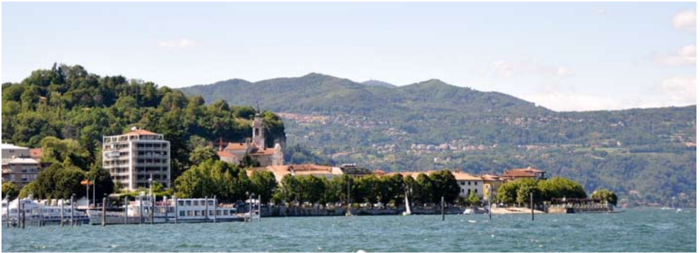
Veduta di Arona