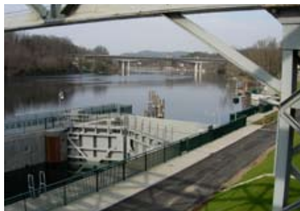
La Conca della Miorina inaugurata nel 2007

Il recupero dell'idrovia Locarno-Milano-Venezia ha avuto inizio nel 1998-99 su iniziativa dell'Associazione Amici dei Navigli, con il contributo della Fondazione Cariplo, con un primo studio di fattibilità. Ad esso sono seguiti, con il contributo dell'Unione Europea, della Confederazione Svizzera e delle Regioni Lombardia e Piemonte, i primi progetti di ristrutturazione e di costruzione delle conche di navigazione. Tra il 2000 e il 2002 abbiamo raccolto il consenso di tutti i sindaci dei Comuni del lago Maggiore, del fiume Ticino, del Canale Industriale e dei Navigli Grande e di Pavia. Quasi tutti hanno sottoscritto senza distinzione politica il protocollo d'intesa per la riattivazione dell'idrovia.