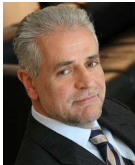
Il Presidente di Regione Lombardia, Roberto Formigoni

Poiché la via d'acqua è interessata da oasi naturalistiche di grande pregio, sarà garantita una navigazione rispettosa della natura e attenta ai valori dell'ambiente e del paesaggio grazie alla scelta di imbarcazioni di dimensioni contenute e dotate di motorizzazione elettrica. L'importanza di questo sistema ambientale e strutturale, è riconosciuta nei progetti del prossimo Expo 2015.