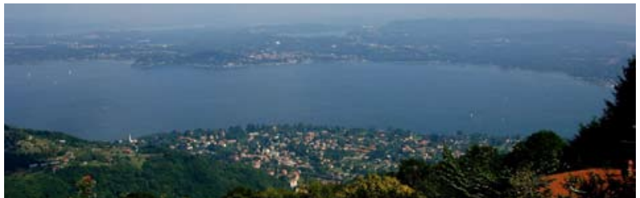
Le colline del Vergante affacciate sul lago Maggiore

Vice Presidente della Provincia di Novara