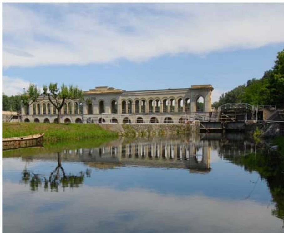
La diga del Panperduto nel Comune di Somma Lombardo (VA)

Roberto Formigoni Presidente Regione Lombardia