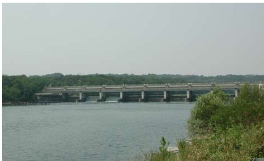
Lo sbarramento di Porto della Torre nel Comune di Varallo Pombia